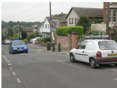
De vrais rétrécissements