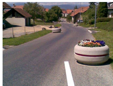
Aménagements plus efficaces