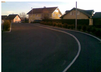
Une autoroute de quartier ?