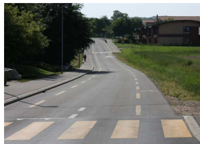
Bravo : Des bandes cyclables

Ces mesures sont-elles efficaces? M. Maccaud nous a fourni quelques chiffres sortis du radar mobile qui est posé de temps à temps au bord des routes challoises. Voici les résultats enregistrés pendant trois jours en avril 2009 au chemin de la Villaire.