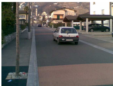
Route étroite avec possibilité de croisement