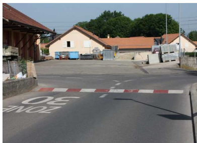
Quelques aménagements !