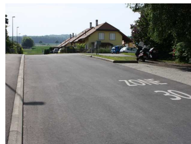
Une piste de Formule 1 ?