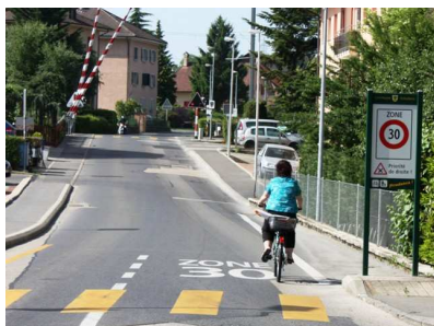
30km/h ? oui surtout pour les vélos !