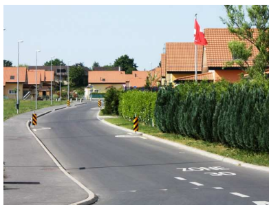
Qui va ralentir ?